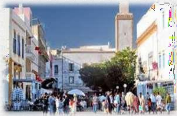
Surfing à Essaouira