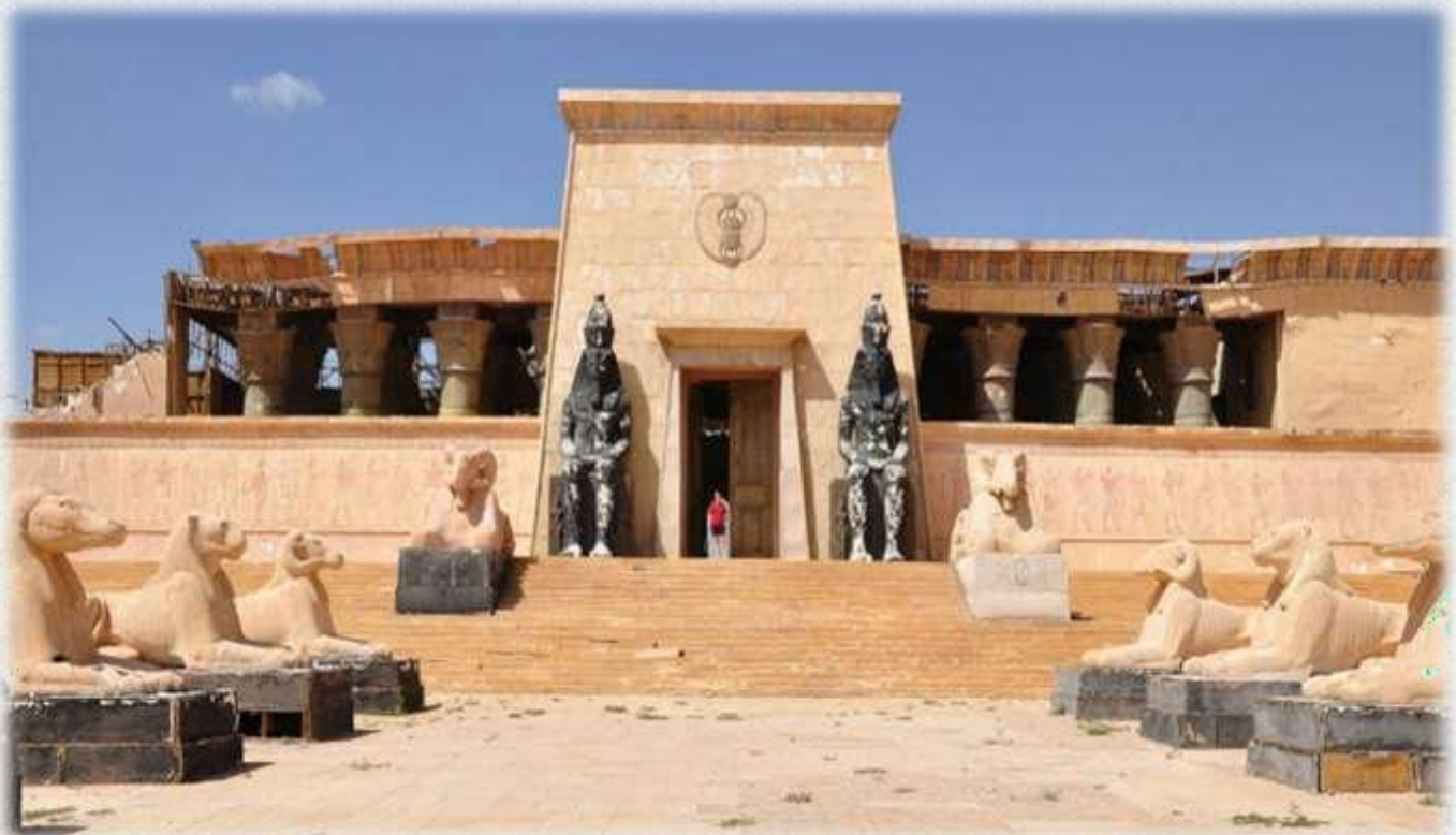
Les Studios Atlas, Ouarzazate