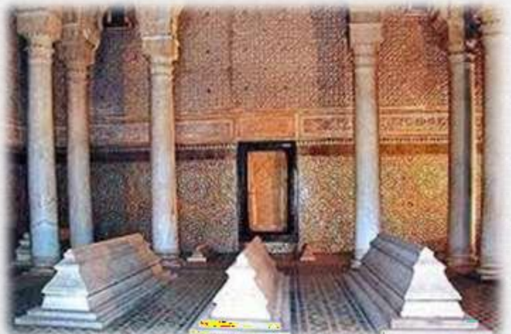
Les Tombeaux Saadiens