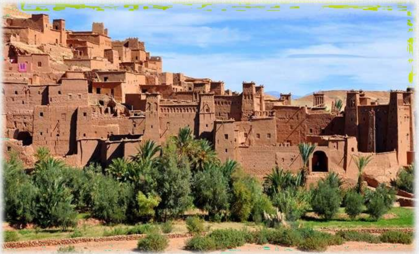
Le village d'Ait Benhaddou