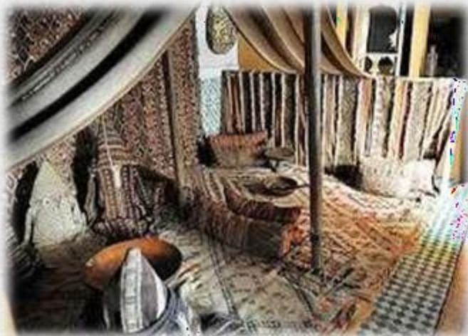
Le Musée Tiskiwin

Bearing in mind that this is a walking tour, appropriate footwear is recommended.